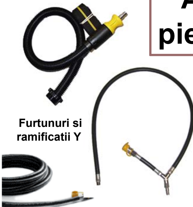
Furtunuri si ramificatii Y