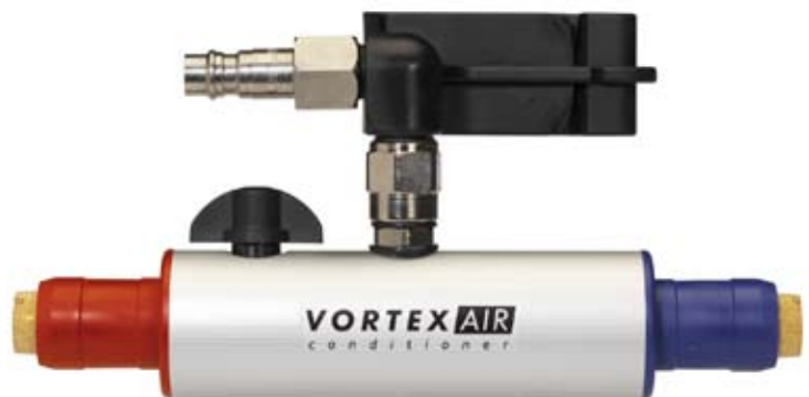
VORTEX Air Conditioner

Vortex functioneaza fara electricitate, freon sau alte chimicale, este mic, usor si sigur.