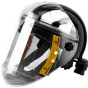
JUNIOR A cod: A114052