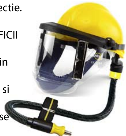
JUNIOR A COMBI cod: A114330

Are un sistem unic de prindere al vizierei inlocuibile, cu cleme, operatie ce se poate realiza si cu masca pe cap.