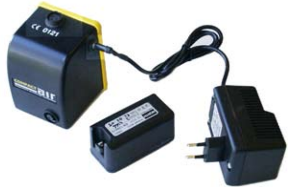
Incarcator acumulatori AirBelt si CompactAir

Vortex incalzeste sau raceste aerul din compresoare in intervalul -20grC - +20grC.