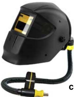
CLASSIC cod: A114642

starea sudurii. Sunt masti de tip "hands-free" fapt care duce la cresterea confortului, nivelului de protectie, precum si a calitatii si productivitatii muncii.