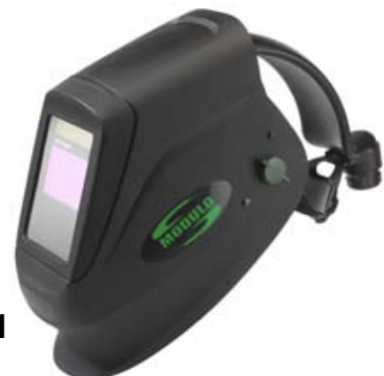
MODULO cod: 91291