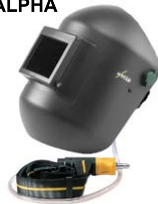
ALPHA cod: A114640