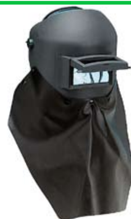
Masca cu protector pentru barbier

Optional sunt dotate cu un protector din piele pentru barbier.