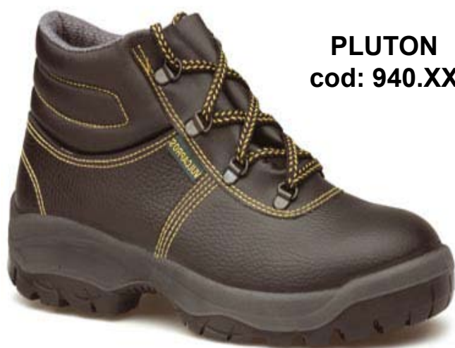
PLUTON cod: 940.XX