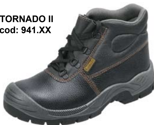
TORNADO II cod: 941.XX